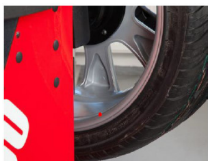
Laser Pointer pro závaží