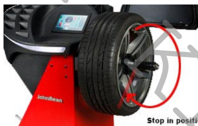
Aut. natočení kola pro závaží (B340P)